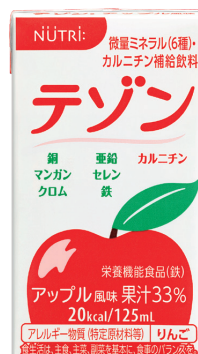
アップル風味 果汁33%