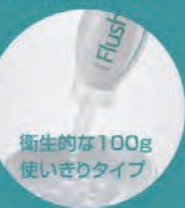
衛生的な100g 使いぎりタイプ