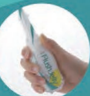
握りやすい容器で 押し出しもラクラク。